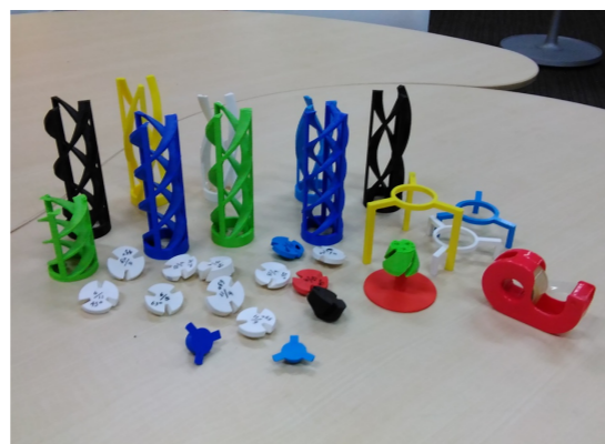
初年次ゼミナール 「3Dプリンターでコマ作り」