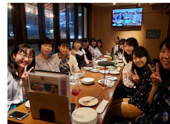
物理学科の女子会