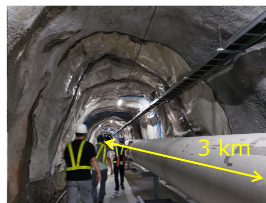
重力波望遠鏡KAGRA @岐阜県神岡鉱山

大学院では、宇宙物理実験の研究室に所属しています。重力波望遠鏡の開発や、その技術を応用した暗黒物質さがしをしています。